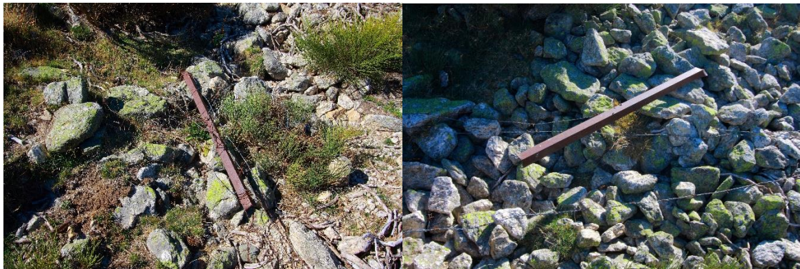
Alambradas en el arroyo Aguilón – Imagen tomada el 8 de octubre de 2017

Tras el éxito de las jornadas de los años 2015 y 2016, en las que socios y simpatizantes de la R.S.E.A. Peñalara retiraron más de 250kg de alambre de espino de las laderas de la Najarra, este año queremos llevar a cabo una acción similar en el arroyo del Aguilón , eliminando estos elementos que afean el paisaje y representan un peligro cierto para los montañeros y para la fauna salvaje, más aún en la época invernal en la que los alambres quedan total o parcialmente ocultos por la nieve.