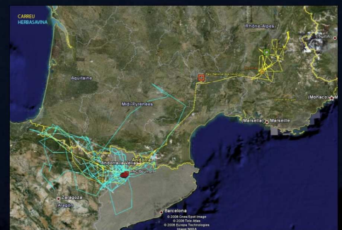
Fig. 3. Movimientos acumulados de los dos buitres negros marcados con emisor satélite (Herbasavina y Carreu). De abril a octubre de 2008.