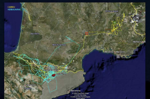
Fig. 3. Movimientos acumulados de los dos buitres negros marcados con emisor satélite (Herbasavina y Carreu). De abril a octubre de 2008.