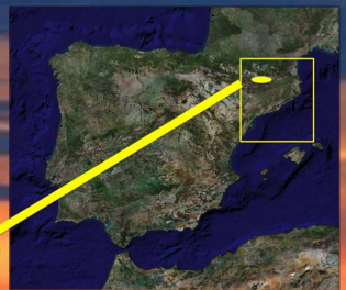
Fig. 1. Ubicación de la zona de reintroducción del buitre negro en el Pirineo catalán.