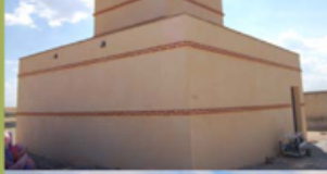
Primillar de Villaviciosa