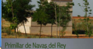
Primillar de Navas del Rey