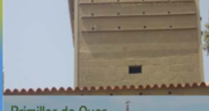
Primillar de Quer