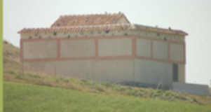
Primillar de Pinto