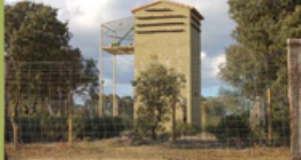
Primillar de Sevilla la Nueva