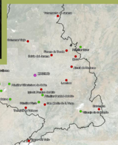
Primillares y colonias naturales primilla 2010