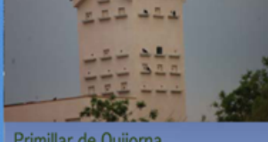
Primillar de Quijorna