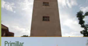
Primillar de Batres