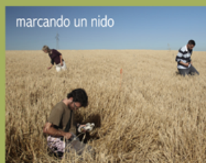
marcando un nido