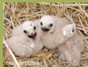
nido de pollos