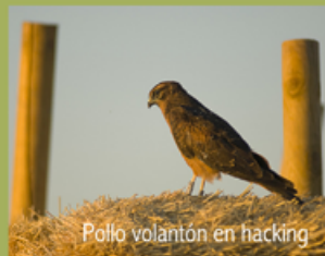
Pollo volánton en hacking