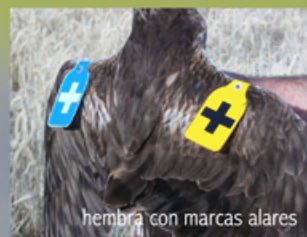
hembra con marcas alares

En la Comunidad de Madrid están presentes como reproductores las tres especies de aguiluchos ibéricos: el aguilucho cenizo ( Circus pygargus ), aguilucho pálido ( Circus cyaneus ) y aguilucho lagunero. ( Circus aeruginosus ).