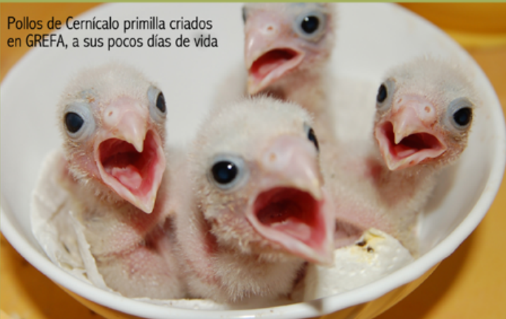
Pollos de Cernícalo primilla criados en GREFA, a sus pocos días de vida