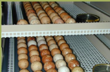
Huevos de Cernícalo primilla preparados para su incubación artificial