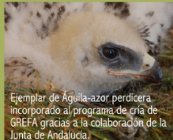
Ejemplar de Águila-azor perdicera incorporado al programa de cría de GREFA gracias a la colaboración de la Junta de Andalucía.