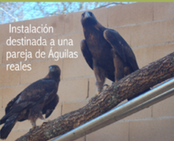
Instalación destinada a una pareja de Águilas reales