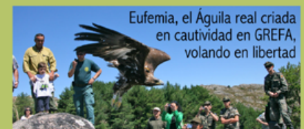
Eufemia, el Águila real criada en cautividad en GREFA, volando en libertad

La cría en cautividad y posterior liberación de fauna silvestre es un instrumento muy importante para conservar y potenciar la biodiversidad.