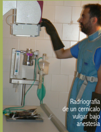
Radiografía de un cernicalo vulgar bajo anestesia