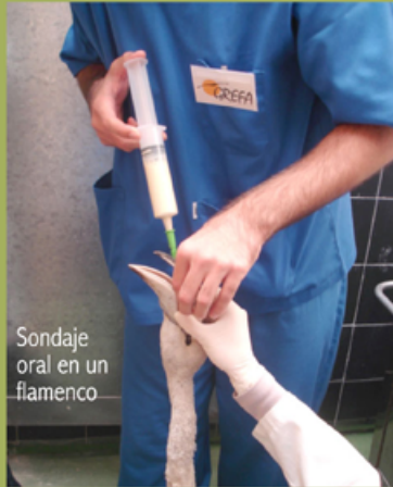
Sondaje oral en un flamenco

Exploración general de una garduña atropellada bajo anestesia