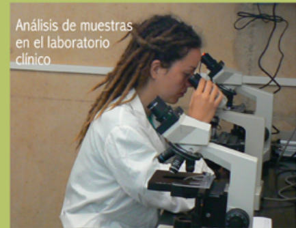
Análisis de muestras en el laboratorio clínico

En el Hospital se procesan más de 1000 muestras clínicas anuales (hematología, bioquímica, coprología y microbiología) a partir de las cuales se concreta qué tipo de patologías padecen nuestros pacientes y decidir así el tratamiento clínico a seguir en cada caso.