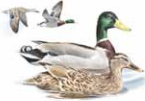
Ánade real (macho y hembra)