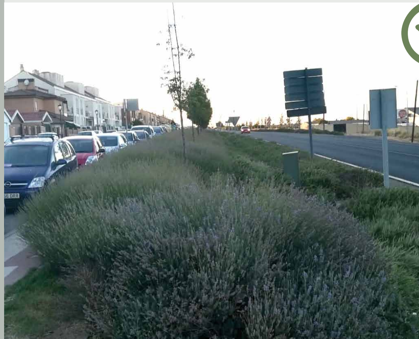
Banda de arbustos autóctonos entre acera y vía urbana.