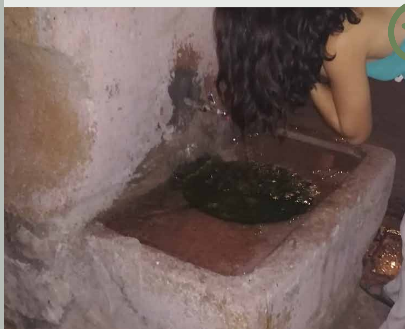
Fuente de abastecimiento con llave de paso en grifo y receptáculo para acumulación de agua accesible a la fauna.