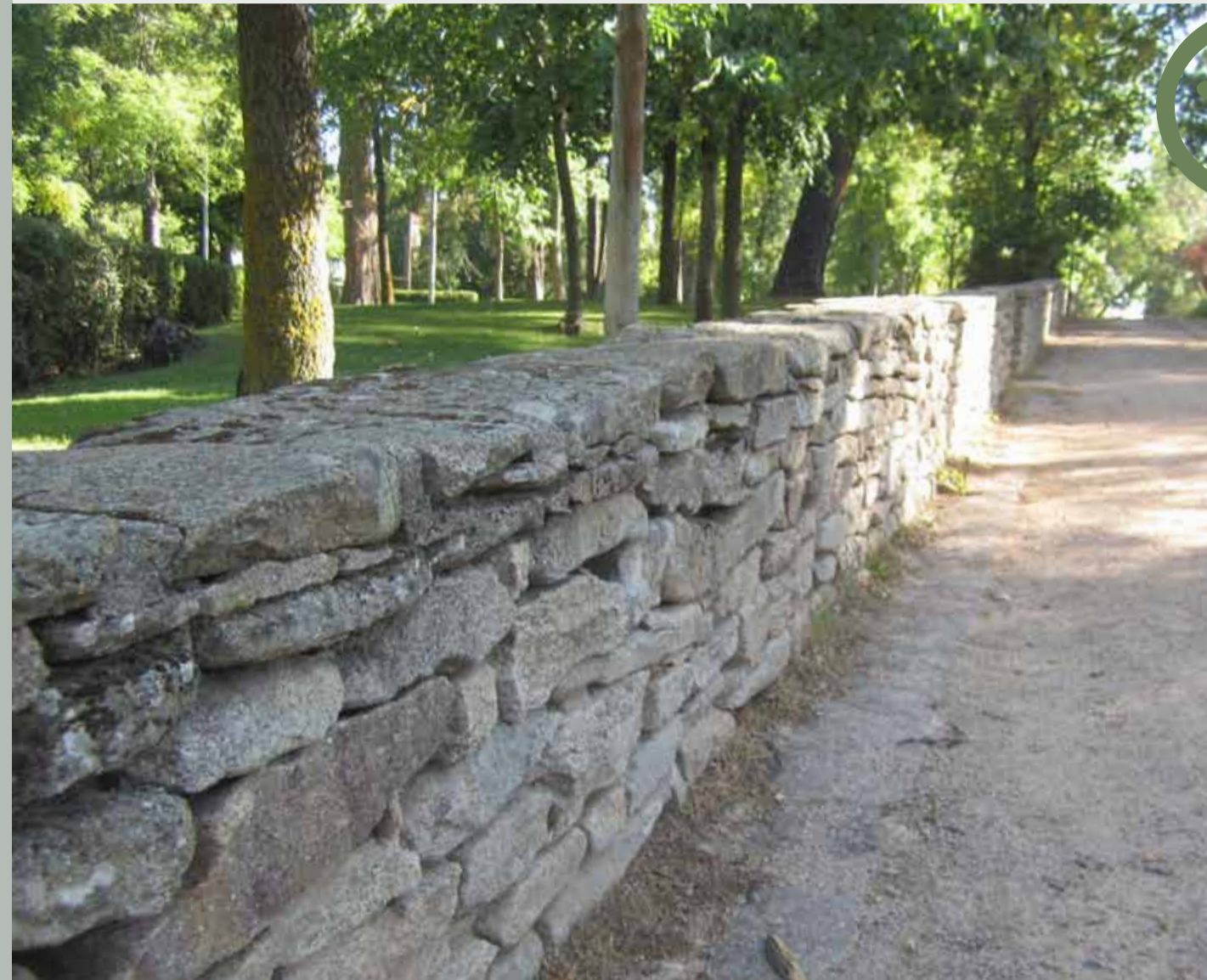
Poyete de mampostería semiseca junto a paseo de zahorra en parque urbano.