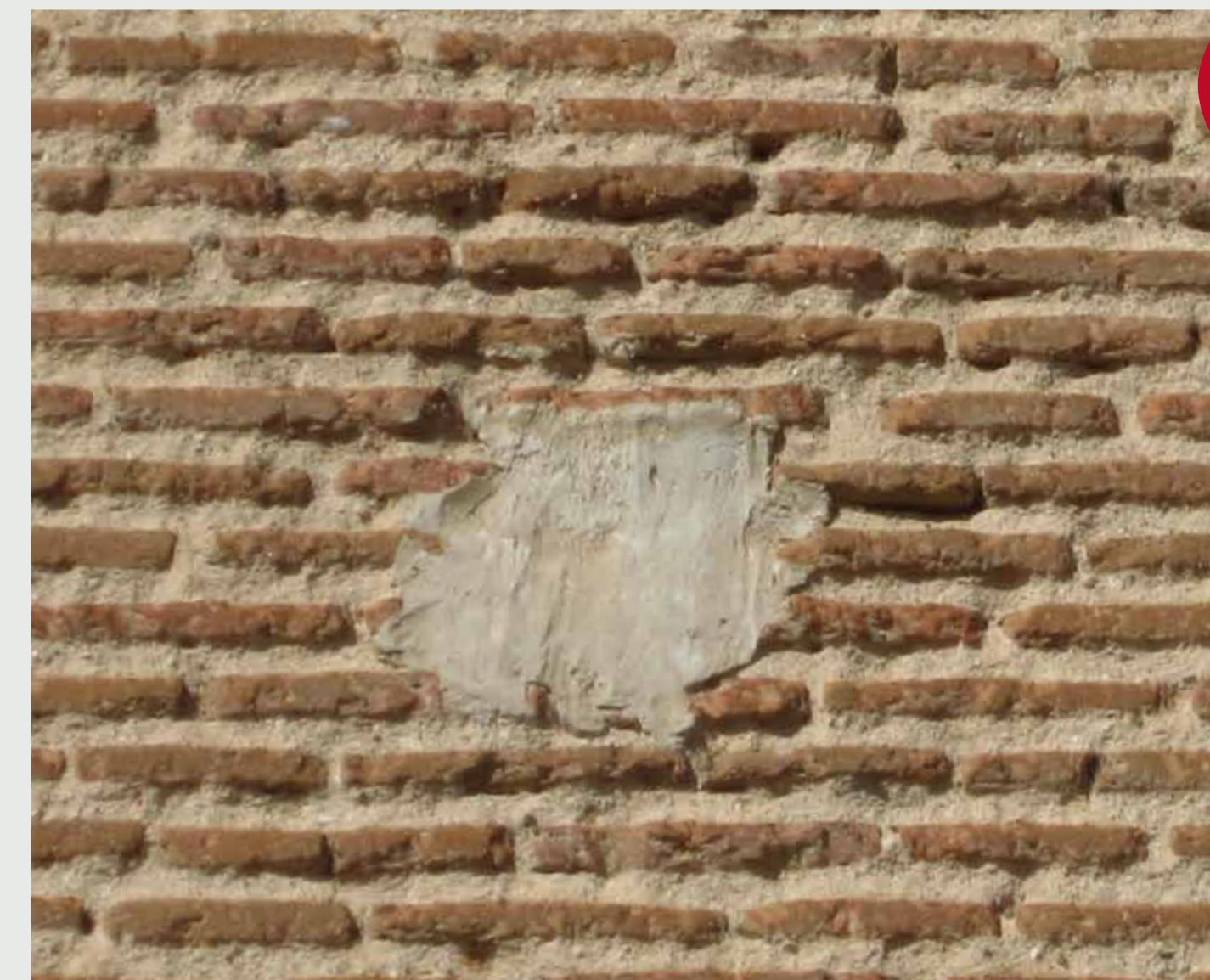
Mechinal tapado con pegote de cemento desluce un edificio patrimonial.

Planificar un equipamiento urbano basado en elementos compatibles con la biodiversidad (mampostería, gaviones, vegetación autóctona, charcas). Los edificios públicos y las nuevas construcciones o reformas de particulares interesados pueden incorporar elementos auxiliares externos para favorecer la nidificación de fauna auxiliar (vencejos, murciélagos, gorriónes, salamanquesas, cernicalos). Practicar reformas de patrimonio respetuosas con las especies.