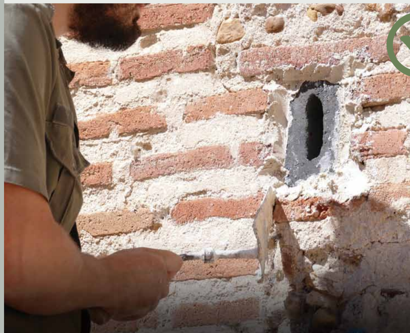
Instalación de placa-nido para murciélagos que impide nidificar palomas en mechinales de edificios históricos.