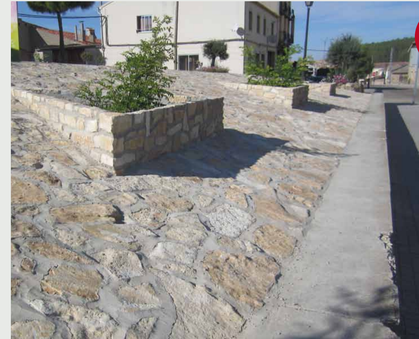
Poyete de hormigón y empedrado de talud con juntas selladas, entre parque urbano y acera.