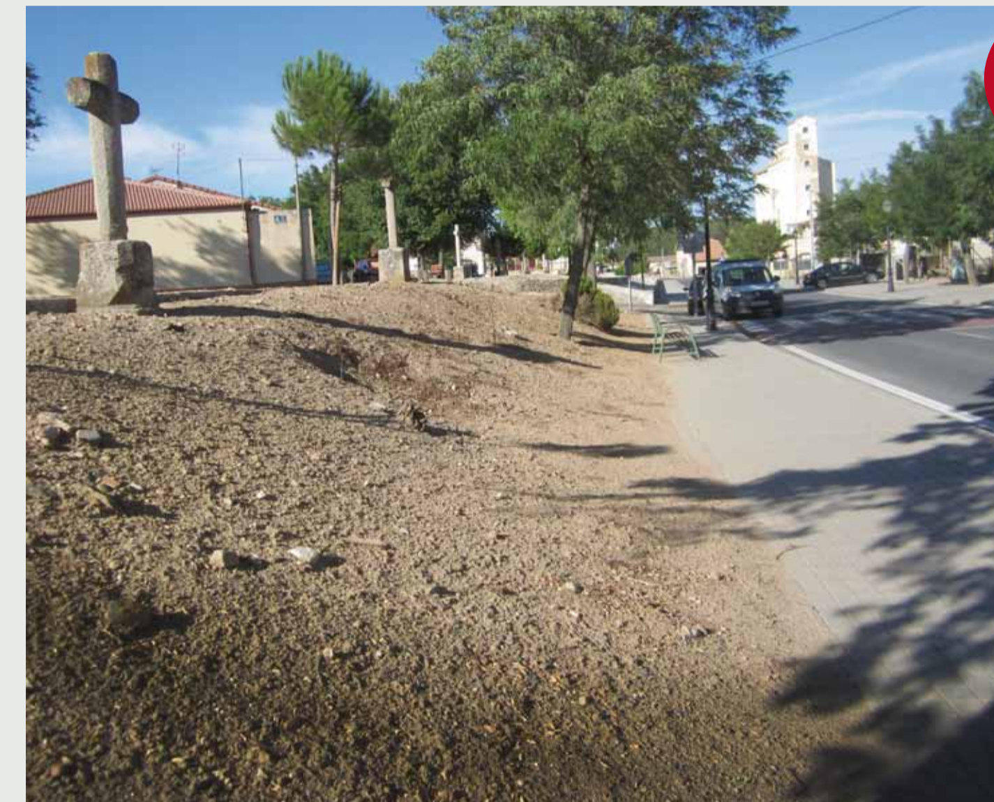
Banda de tierra desnuda junto a acera por tratamiento con herbicida.

Erradicar el uso de herbicidas. Enseñar y promover la flora urbana por sus servicios ecosistémicos: polinización, suavización de temperaturas, preservación edáfica, filtración y retención de escorrentías, alimento y refugio de fauna auxiliar, embellecimiento, equilibrio.