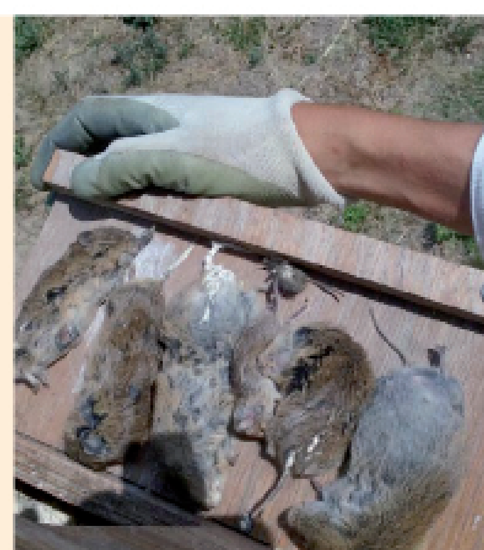
La presencia masiva de cadáveres de forma simultánea incrementa el riesgo de transmisión de enfermedades como la tularemia.

Muchos de ellos ya han sido prohibidos debido a los riesgos ambientales derivados de su afección a especies no diana, tanto por consumo directo como por consumo secundario al pasar a través de la cadena trófica.