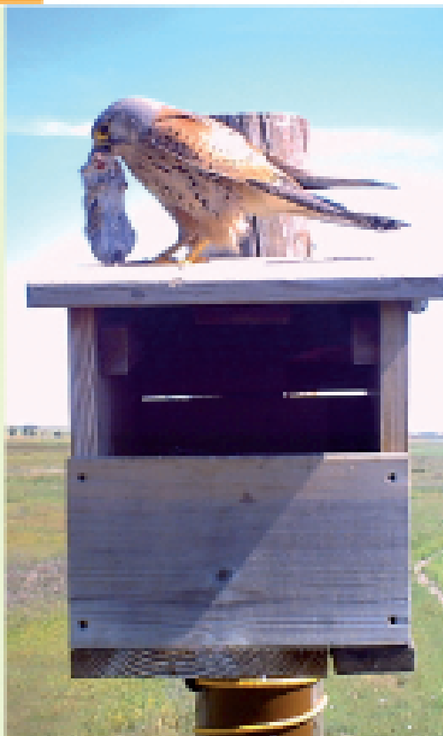
Un cernicalo envenenado y muerto dejará de consumir unos 1000 topillos anuales.

El control biológico con rapaces consiste en la facilitación de sustrato de nidificación a depredadores naturales: el cernicalo vulgar ( Falco tinnunculus ) y la lechuza común ( Tyto alba ) mediante la instalación de cajas nido.