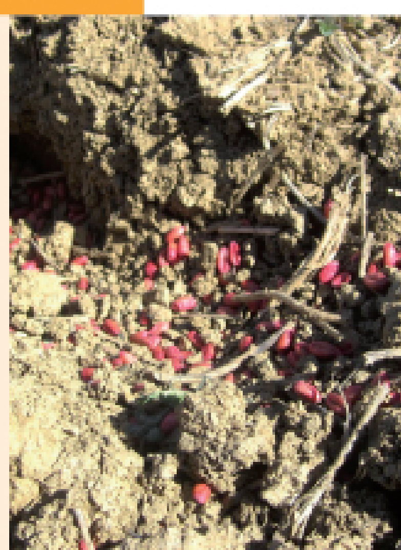
El uso de rodenticidas químicos provoca importantes pérdidas de biodiversidad.

La gestión de plagas de topillo en estos territorios se ha basado en gran medida en el uso de rodenticidas anticoagulantes (venenos).