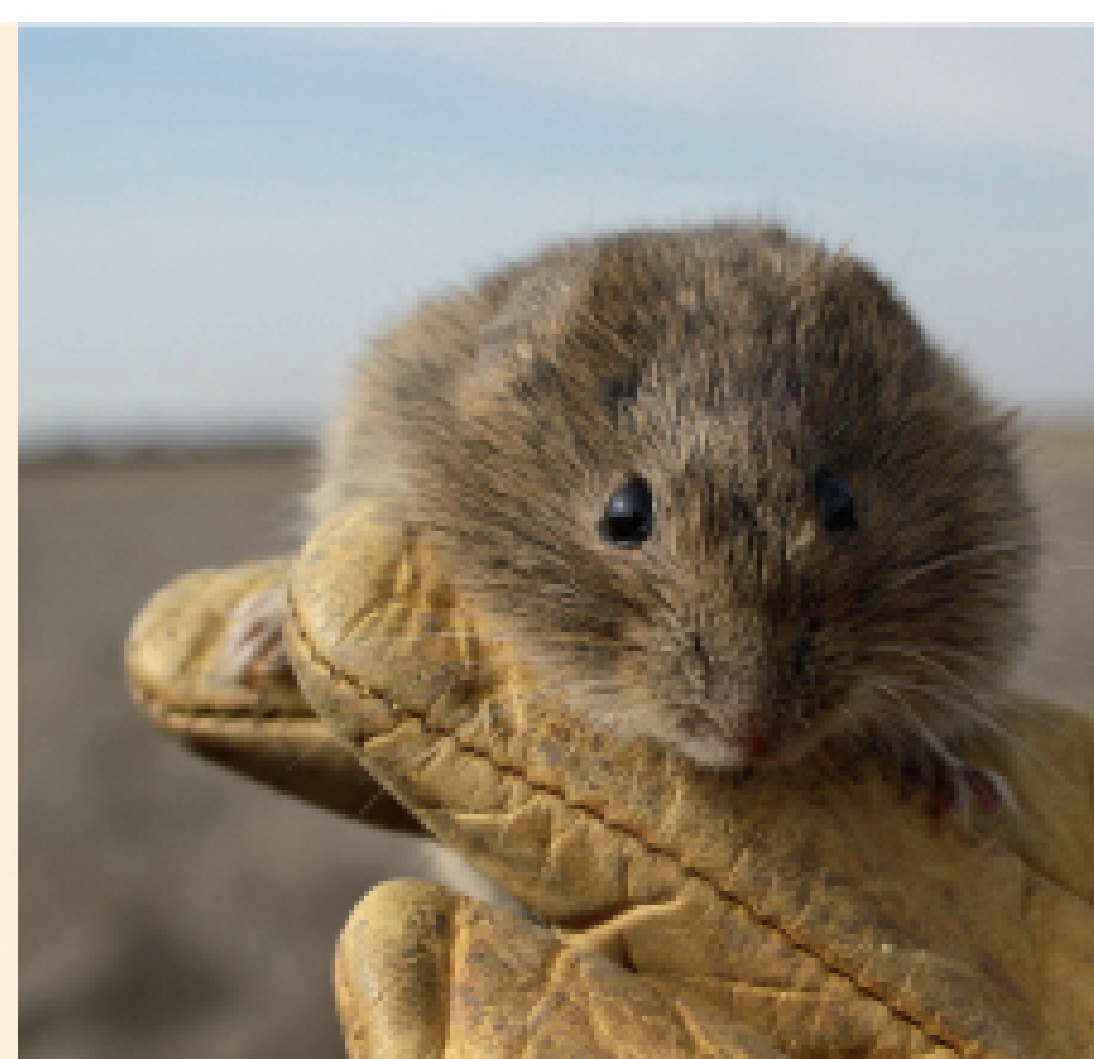
el topillo campesino se alimenta preferentemente de hierba verde.

Provoca importantes pérdidas económicas durante sus explosiones demográficas cíclicas.