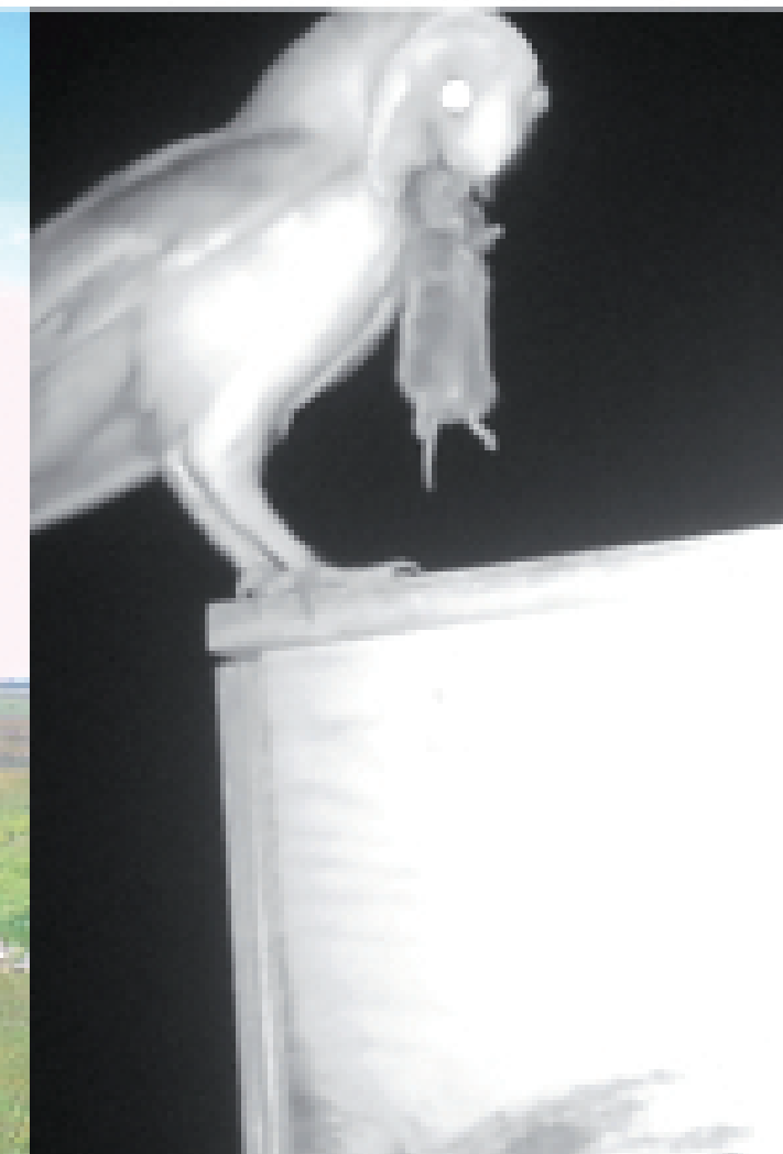
Favorecer la presencia de rapaces diurnas y nocturnas aumenta la eficacia del control las 24 horas del día.

Otras medidas que ayudan al control biológico son: