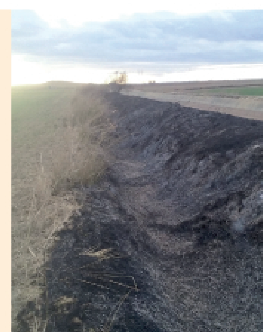
El fuego provoca pérdida directa o indirecta de depredadores y también de otras especies, incluidas las cinegéticas. El topillo se traslada al interior de los cultivos.

Otra medida extendida es la quema de linderos. El fuego agrava la situación.