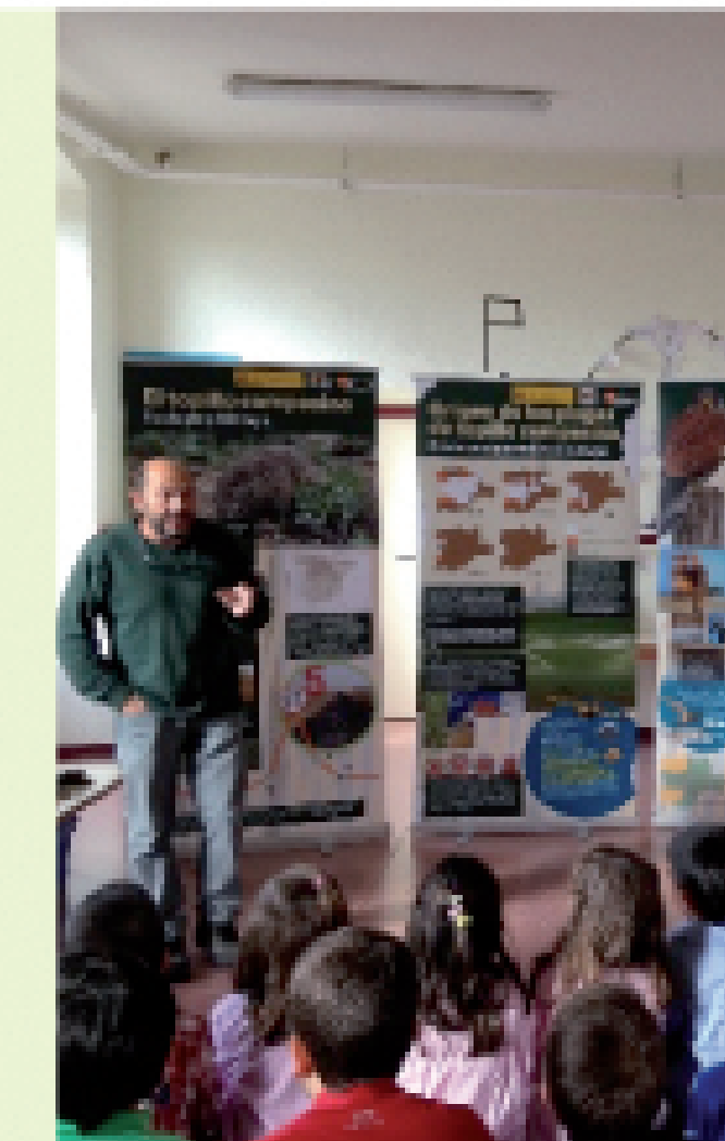
Información y sensibilización a la población rural: con especial atención a los sectores agrícola y cinegético, municipios, administraciones e incluyendo a los escolares.