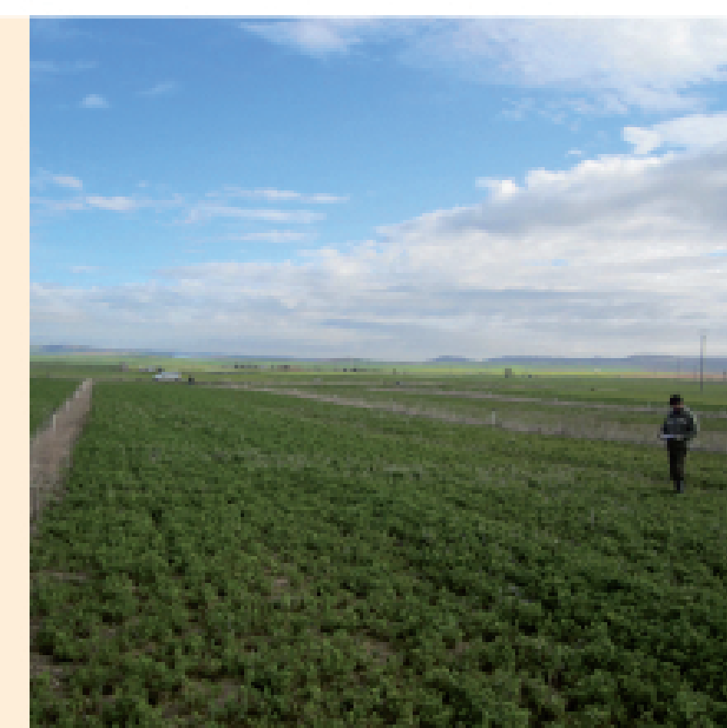
Cultivos de regadío y pocos refugios para depredadores.

Actualmente se encuentra presente en prácticamente toda la meseta norte, ya que se ha visto favorecido por el aumento de los cultivos de regadío, especialmente por las alfalfas ( Medicago sativa ).