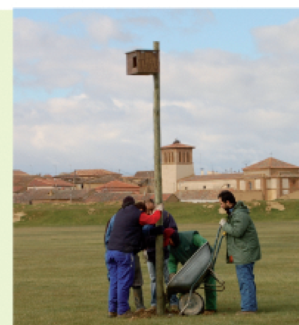
Facilitar lugares de nidificación y oteaderos de caza. Muchos agricultores ya se implican en su instalación.

MUNICIPIOS CASTELLANO LEONESES ADSCRITOS A LAS PRINCIPALES INICIATIVAS DE CONTROL BIOLÓGICO DE LA PLAGA DEL TOPILLO (2009-2017)