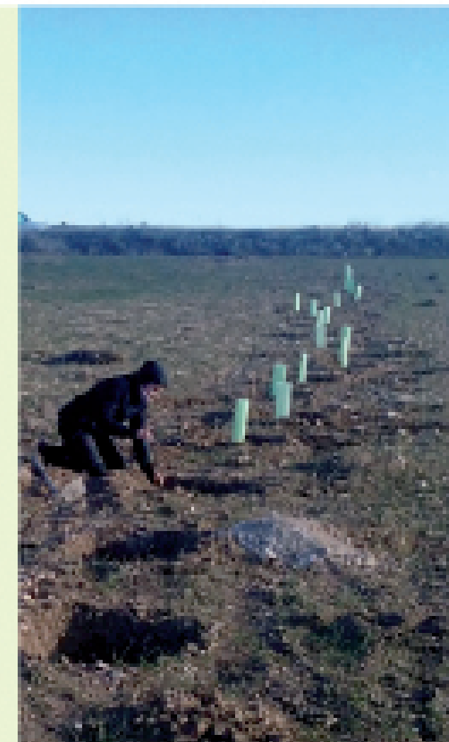
Revegetación de linderos

Otras medidas que ayudan al control biológico son: