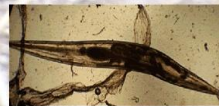
Fig. 3: adulto hembra de la familia Pharingodonidae (x10)