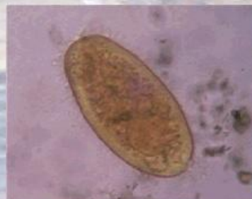
Fig.6: ciliado del género Nyctotherus teñido con lugol (x40)