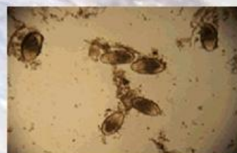
Fig. 1: huevos de nematodo de la familia Pharingodonidae (x20)

Las prevalencias de dichos parásitos están reflejadas en la tabla 2.