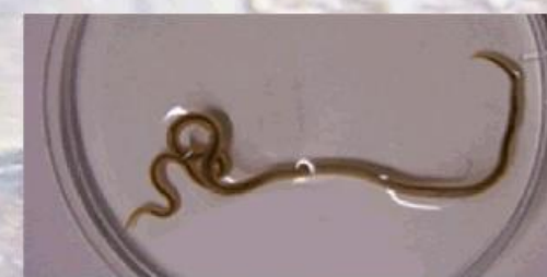
Fig.5: adulto de la familia Atractidae expulsado por una de las tortugas mora