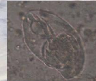
Fig. 7: ciliado del género Nyctotherus sin teñir (x40)