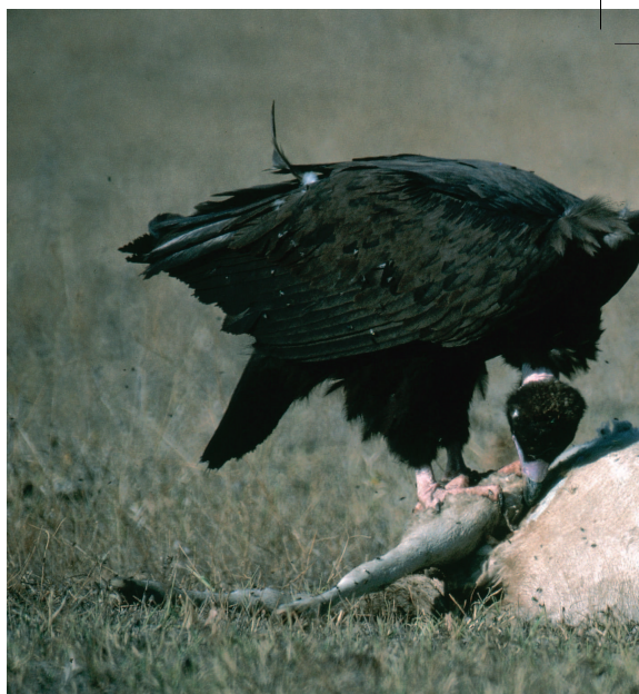
▲ Buitre negro sobre una carroña de oveja en una llanura castellana. Sin el mantenimiento de las áreas de alimentación, la protección estricta de las colonias donde cría la especie puede ser insuficiente.

Gracias a todos estos estudios, hoy en día sabemos bastante de los buitres negros que se reproducen en el sistema Central, sus áreas de campeo y dispersión, así como las amenazas que gravitan sobre ellos. Así, podemos hablar de tres colonias de cría entre las sierras de Guadarrama y Gredos, que suman unas 250 parejas. Dos de ellas son bastante grandes, una en el noroeste de Guadarrama, a caballo entre las provincias de Madrid y Segovia (valle del Lozoya y pinares de Valsaín), con más de cien parejas, y otra en el macizo oriental de Gredos (valle abulense de Iruelas), también por encima del centenar. Entre ambas, en el extre-