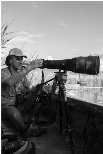
FRANCISCO MÁRQUEZ Fotógrafo y cineasta profesional especializado en historias sobre la naturaleza y el hombre, con importantes publicaciones y premios en todo el mundo y profundamente comprometido con el arte y la conservación.