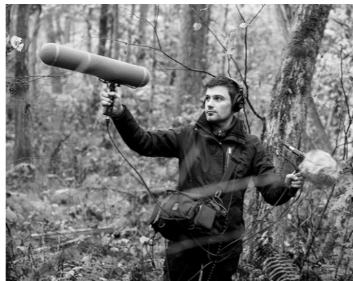
JOSÉ BAUTISTA Editor multimedia, compositor, diseñador sonoro y videoartista, con importantes premios internacionales e instalaciones sonoras expuestas en galerías de España, Japón, Moscú, Francia e Inglaterra.