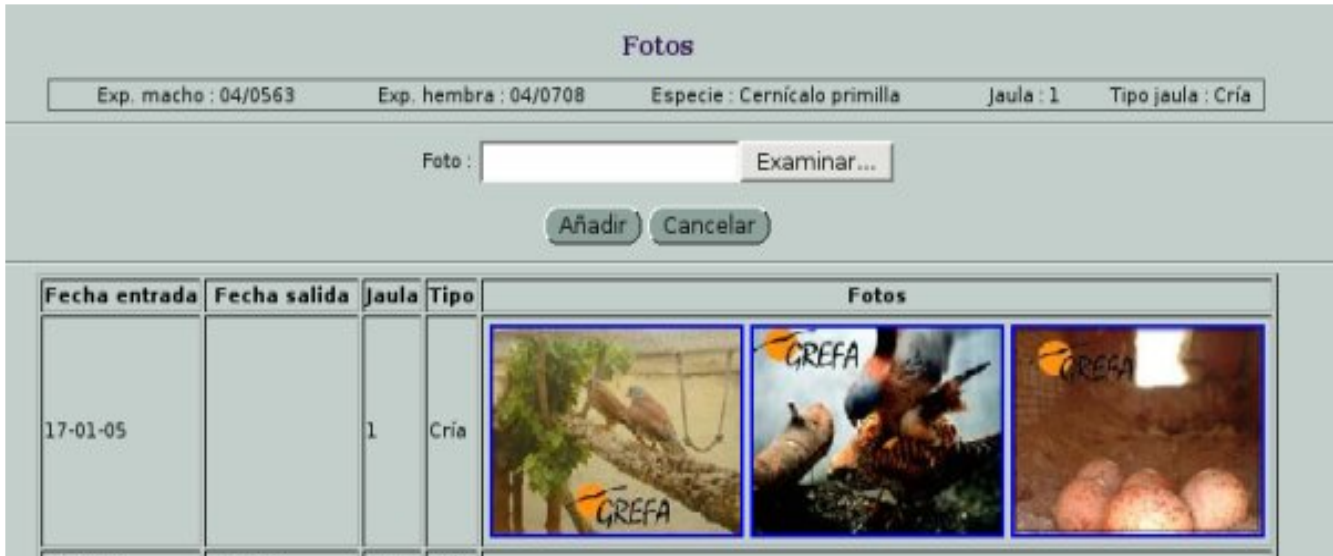
Seguimiento de la historia de una pareja mediante fotos

Antes de empezar a dar de alta los huevos, es necesario dar de alta las salas de incubación e incubadoras que vayamos a usar en la cría e indicar la temperatura y humedad de estos.