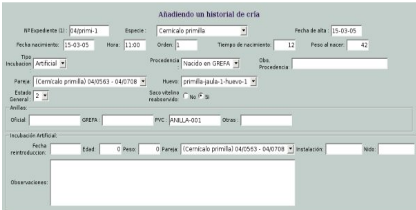
Ficha de un pollo nacido en cautividad

Después existe un fichero especial llamado "Proyectos de Cría", en el que debemos incluir una ficha por cada especie en la que indicaremos datos relativos a la incubación, como el número de días hasta el nacimiento. Estos datos pueden ser usados más adelante para realizar los gráficos de evolución de la incubación.