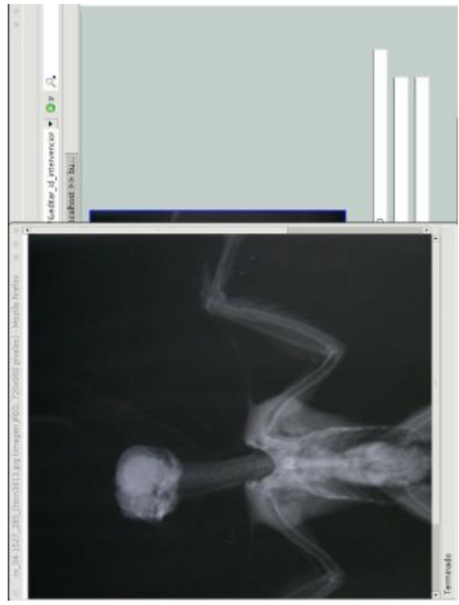
Detalle de la radiografía