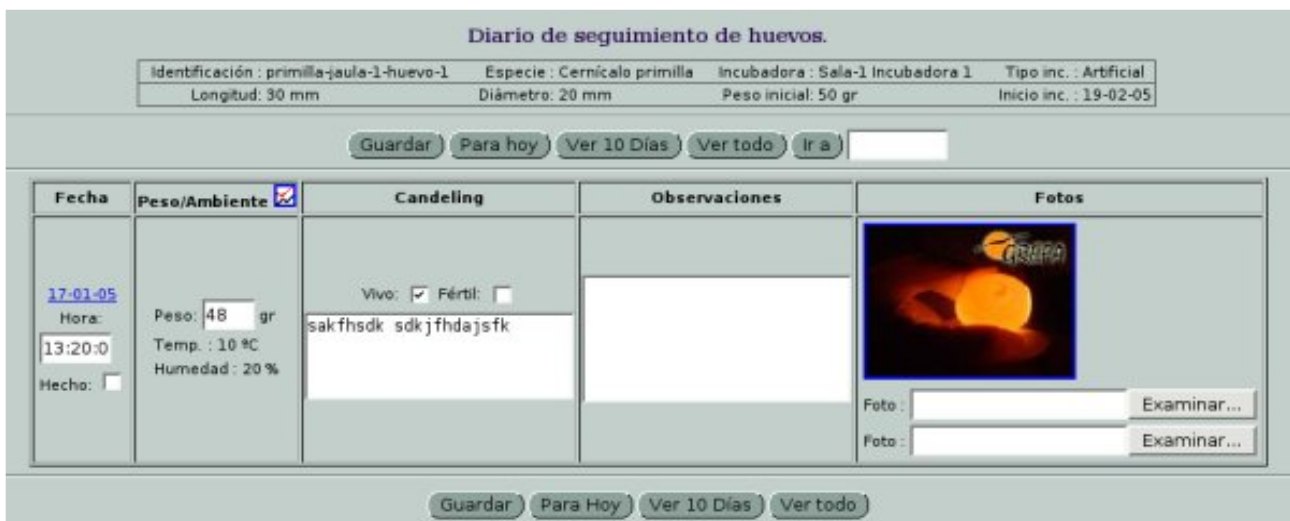
Diario de seguimiento de huevos

Una vez dado de alta al pollo podemos apuntar en otro "Diario" cuantas observaciones queramos hasta el momento de la liberación.