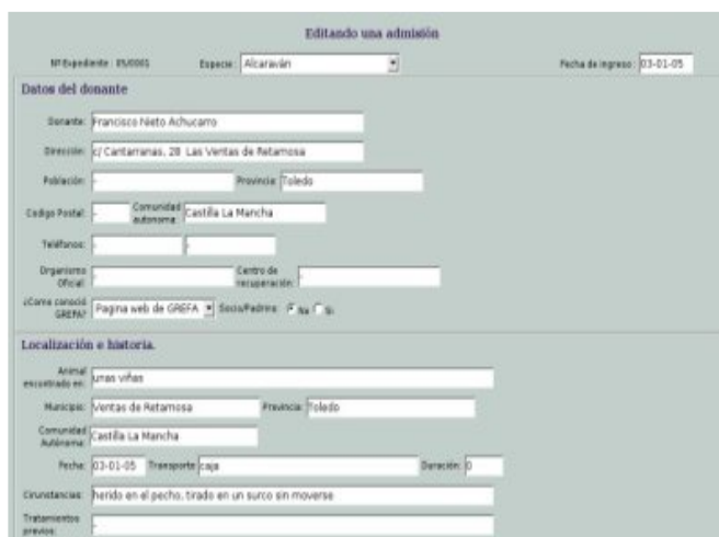
Ficha de Admisión

el manejo de los programas se realizan a través de páginas web.