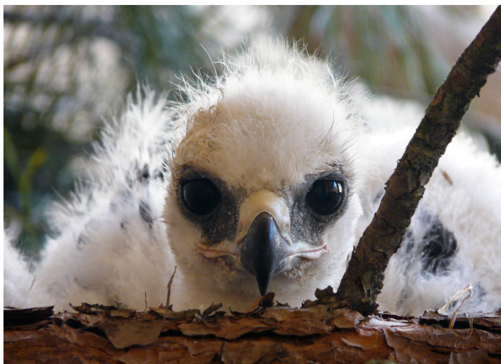
Foto 2. Romero y Torvisco nacidos en GREFA en 2011.