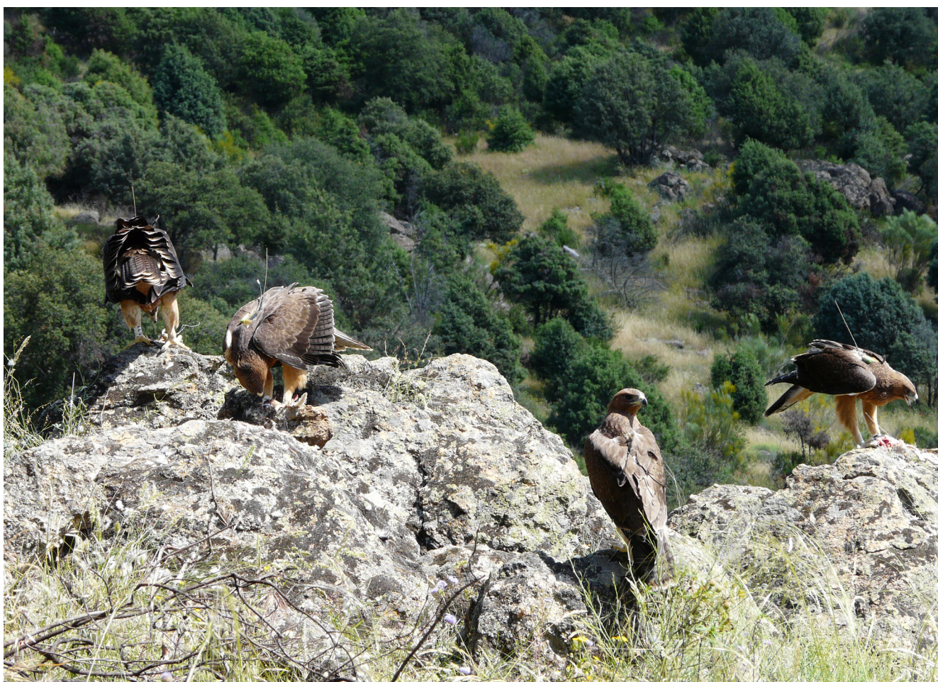
Foto 4. Jara, Atalaya, Romero y Torvisco. Liberados en 2011.

Los primeros movimientos fuera del nido de los ejemplares ocurrieron cuando tienen entre 57-64 días ( M=60,16 , DesvStan=2,48 ; n=6 ). Se trata de ejemplares muy activos que pueden salir del nido aunque todavía no puedan volar activamente