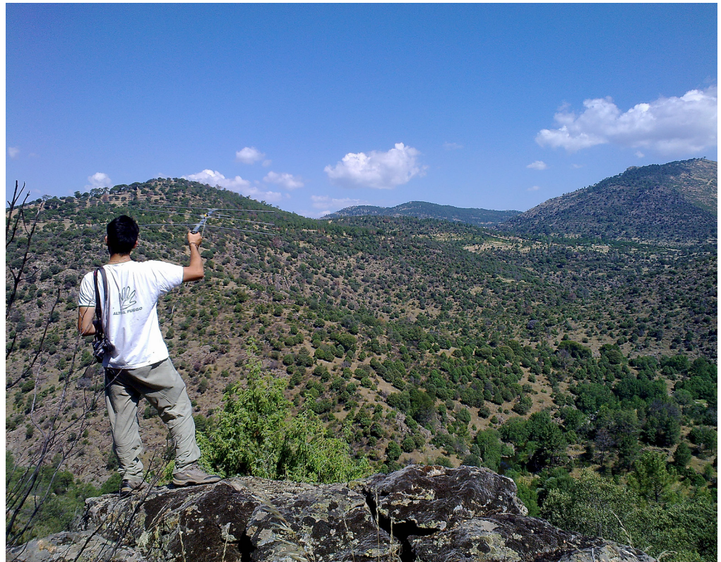
Foto 3. Seguimiento en el área de liberación.

La metodología de liberación se basa en la filopatría (tendencia de las especies a volver a criar en el lugar de nacimiento). Para ello utilizamos el método “Hacking o crianza campestre” que consiste en liberar a los ejemplares cuando ya son capaces de alimentarse por sí solos con la comida que se le aporta, pero todavía no son capaces de volar. Con esto conseguimos el “imprinting” a la plataforma de liberación y posteriormente volverán a ésta para conseguir el alimento que le seguiremos facilitando hasta su posterior emancipación del área.