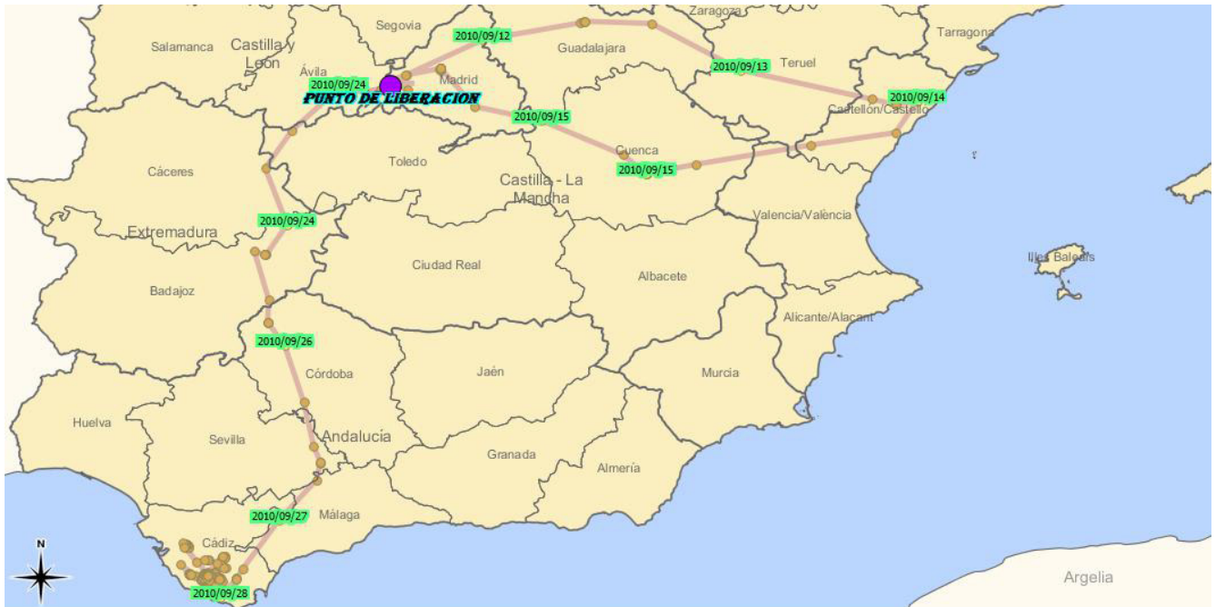
Figura 1. Movimientos de Graná hasta su desaparición en Cádiz.

De los 6 ejemplares, 3 siguen vivos y emitiendo; 2 murieron electrocutados en tendidos corregidos dentro de la Comunidad de Madrid, y uno desapareció su señal en la Laguna de la Janda (Cádiz) (Figura 1).